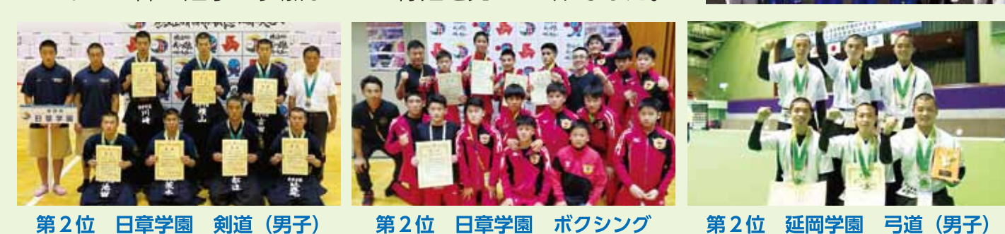
第2位 日章学園 剣道(男子) 第2位 日章学園 ボクシング 第2位 延岡学園 弓道(男子)

宮崎県は30競技に約650名の選手団で臨みました。3年ぶりの総合開会式には本県からは都城商業高校の女子バレーボール部の選手が参加し堂々の行進を見せられました。